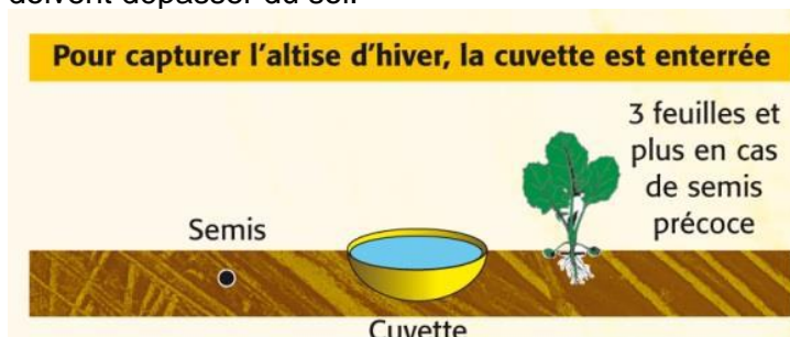
Schéma de la disposition de la cuvette jaune pour capturer l'altise d'hiver.

L' altise d'hiver fait exception à cette règle. En effet, il s'agit d'un insecte qui se déplace par des sauts. L'objectif est donc de capturer l'insecte lorsqu'il se déplace en enterrant la cuvette dans le sol. Seule 1-2 cm de rebord doivent dépasser du sol.