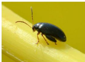
Grosse altise adulte

Il s'agit d'un gros coléoptère de 3 à 5 mm de long au corps noir et brillant avec des reflets bleus métalliques sur le dos. Les extrémités des pattes, des antennes et de la tête sont roux dorés. Elle est reconnaissable aussi par des « grosses cuisses » qui lui permettent de sauter pour se déplacer dans la parcelle.