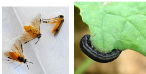
Tenthrede à l'état adulte (gauche) et larvaire (droite)

La tenthrede est un hyménoptère qui à l'état adulte mesure 7 à 8 mm, présente un corps jaune orangé, à tête noire et aux ailes membraneuses. La larve mesure 20 à 50 mm. Elle est translucide, grisâtre voire verdâtre. Elle prend un aspect noirâtre en fin de développement et devient nuisible pour la culture en dévorant les feuilles.