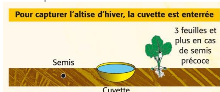
Schéma de la disposition de la cuvette jaune pour capturer l'altise d'hiver.

L'altise d'hiver fait exception à cette règle. En effet, il s'agit d'un insecte qui se déplace par des sauts. L'objectif est donc de capturer l'insecte lorsqu'il se déplace en enterrant la cuvette dans le sol. Seule 1-2 cm de rebord doivent dépasser du sol.