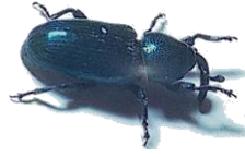
Baris (Terres Inovia)

Attention à ne pas confondre le CBT avec le baris des crucifères. Le baris présente un rostre beaucoup plus recourbé et sa nuisibilité pour la culture n'est pas avérée.