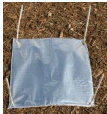
Piège à limace.

Cette observation nécessite une attention particulière. En effet, le relevé des pièges doit s'effectuer en début de matinée en conditions fraîches et humides et en « grattant » la terre sous les pièges car les limaces sont généralement abritées entre les mottes dans les premiers cm du sol.