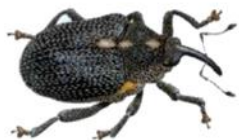
Charançon du bourgeon terminal

Le CBT adulte mesure de 2.5 à 3.7 mm. Corps brillant et noir avec une pilosité courte clairsemée. Tâches latérales blanches entre le thorax et l'abdomen. Extrémités des pattes rouges.