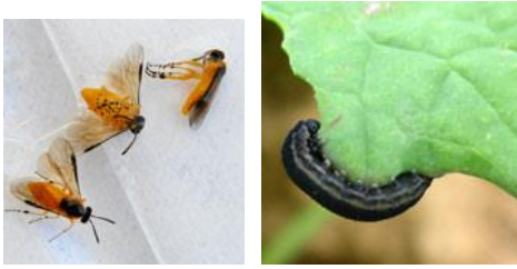
Tenthrede à l'état adulte (gauche) et larvaire (droite)

La tenthrede est un hyménoptère qui à l'état adulte mesure 7 à 8 mm, présente un corps jaune orangé, à tête noire et aux ailes membraneuses. La larve mesure 20 à 50 mm. Elle est translucide, grisâtre voire verdâtre. Elle prend un aspect noirâtre en fin de développement et devient nuisible pour la culture en dévorant les feuilles.